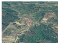
衣・食・住・エネルギーの未来を考える