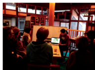
フィールドワーク