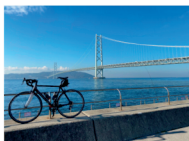
サステナブル講座