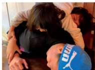
家族という最小単位の社会を学ぶ