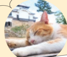
猫城主さんじゅーろー